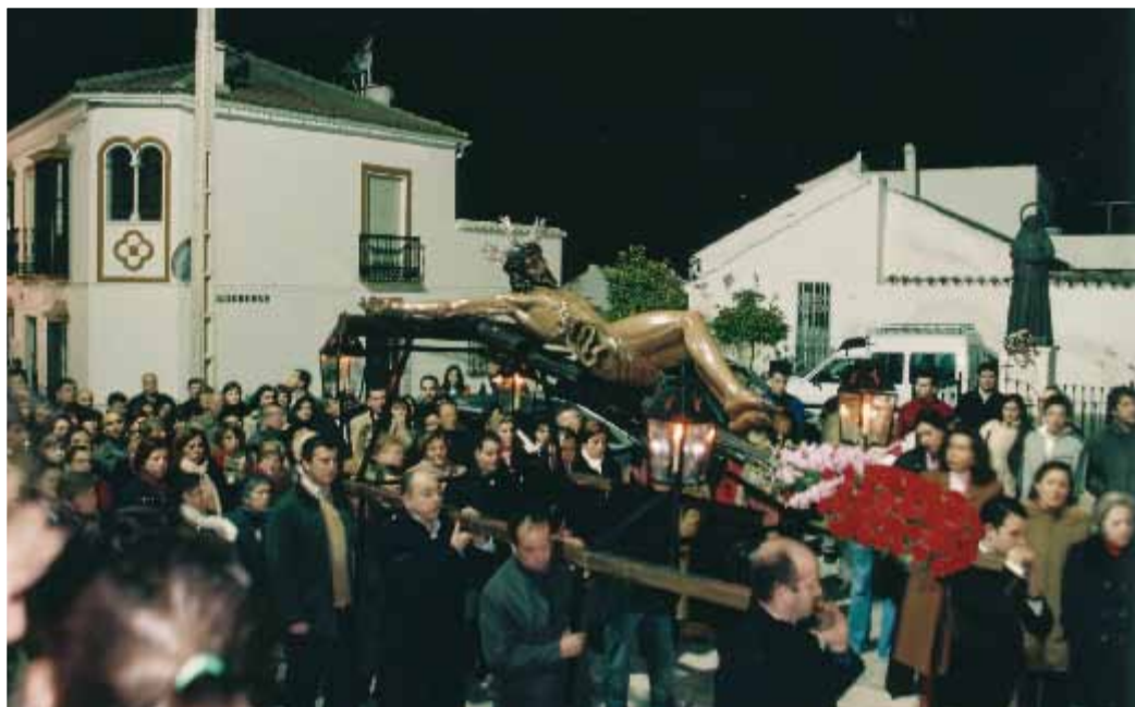
Stmo. Cristo de la Salud en Plaza Sor Ángela de la Cruz, solemne Vía Crucis, año 2005

Pero el Cristo de la Salud no sólo nos sobrecoja este día, sino cuando sale en vía crucis para su quinario cuaresmal desde el seráfico convento de los franciscanos, hasta el convento de esas hermanas de la Cruz, que han hecho de la caridad y la ayuda al prójimo su forma de vida, como bien les enseñó esa San-