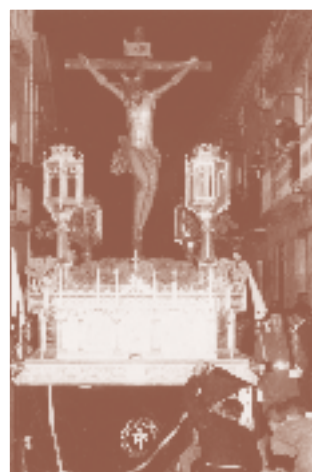
Estación de Penitencia, madrugada del Jueves Santo, año 1963, calle Mesones (antigua casa Pico)

El primero por festivo, porque fiesta ha de ser la consecución de una nueva Casa de Hermandad, que constituye en sí misma un logro