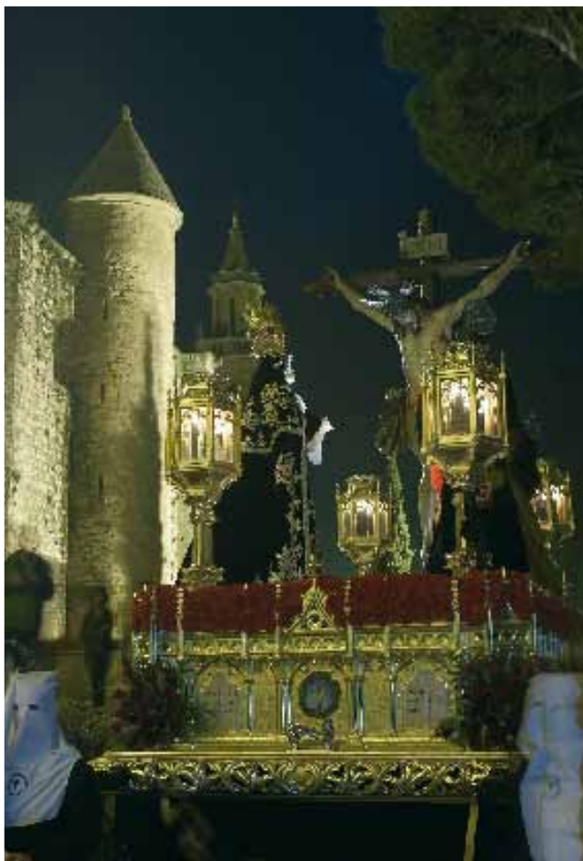
Paso por la Iglesia de Santa María la Mayor y Matriz, Semana Santa 2005

la que se sube por una empinada escalera, accediendo a una pequeña plataforma en la que apenas te dejan estar cinco minutos. Subiendo al