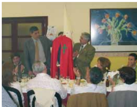
Comida de confraternidad, celebrada el pasado Miércoles Santo, entre las dos hermandades.