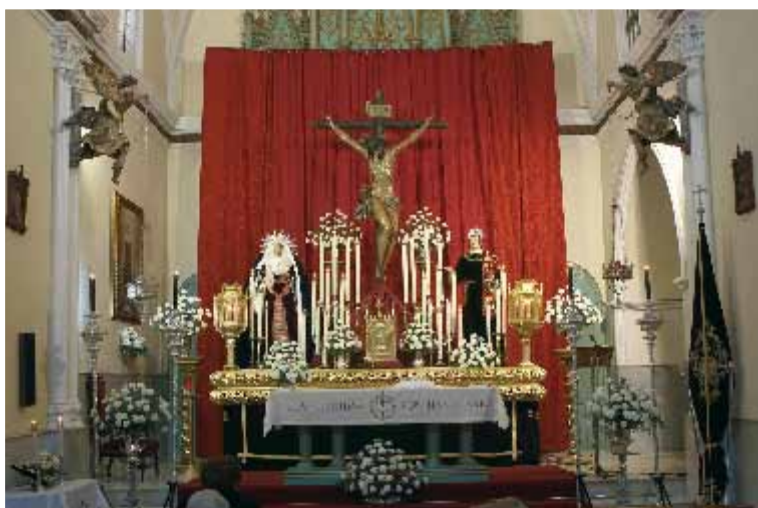
Altar de cultos, Quinario 2005