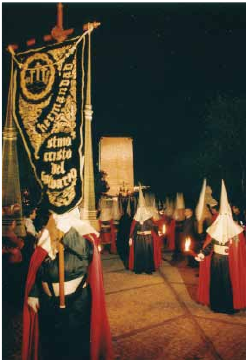
Hermandad del Calvario de Alcora (Castellón) en nuestra Estación de Penitencia año 2005